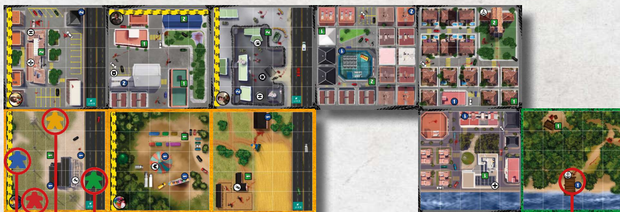
Casillas de Inicio de Grupos